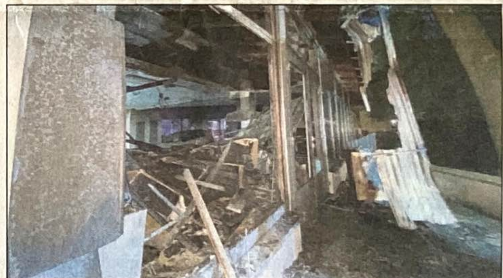
Die Freiwillige Feuerwehr Bad Soden wurde im vergangenen Jahr zu zig Brandeinsätzen, Türöffnungen, überschwemmten Kellern, Beseitigung umgestürzter Bäume, Tierrettungen und vielem mehr gerufen.